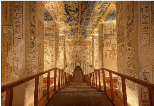
Grabanlage in Ägypten